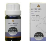
(公益社団法人)日本アロマ環境協会 表示基準適合認定精油